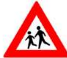
een pas op bord