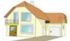
een huis met een garage