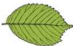
een groen blad