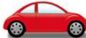
een rode auto